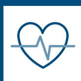
BF Fit & Fun.

Betriebliche Alters- und Gesundheitsvorsorge Mitarbeiterabbatte Kindergartenzuschuss VL-Zuschuss Weihnachtsgeld